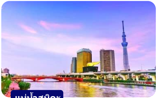
แม่น้ำสุมิดะ

นำท่านเดินทางสู่ วัดอาซากุสะ (Asakusa) วัดที่เก่าแก่ที่สุดในกรุงโตเกียว ขอพรจากเจ้าแม่กวนอิมทองคำ ท่านยังจะได้เก็บภาพประทับใจกับโคมไฟขนาดใหญ่ที่มีความสูงถึง 4.5 เมตร ซึ่งแขวนอยู่บริเวณประตูทางเข้าวัด และยังสามารถเลือกซื้อเครื่องรางของขลังได้ภายในวัด ฯลฯ หรือเพลิดเพลินกับ ถนนนากามิเสะ ถนน ซอปปิ้งที่มีชื่อเสียงของวัด มีร้านขายของที่ระลึกมากมายไม่ว่าจะเป็นเครื่องรางของขลัง ของเล่นโบราณและตบท้ายด้วยร้านขายขนมที่คนญี่ปุ่นชื่นชอบ แม้กระทั่งองค์จักรพรรดิปัจจุบันยังเคยเสด็จประพาสและเสวยขนมร้านดังนี้อีกด้วย